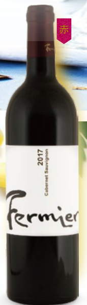
フェルミエ カベルネソーヴィニオン 750ml 4,450円