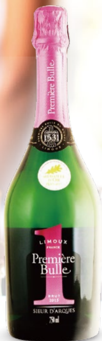
ブルミエール・ピュル・ブリュット ブランケット・ド・リムー 750ml 1,880円