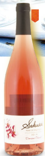
ドメヌ・シュヴロ 750ml 2,580円