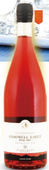
都農ワイン キャンベルアーリードライ 750ml 1,300円