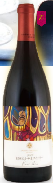
信州たかやま ピノノワール 2017 750ml 2,750円

本格派でワイン好きに大好評の、ホンダヴィンヤーズ フェルミエシリーズ。スペイン北部の品種「アルバリーニョ」を使用した爽やかな白と、王道国際品種の「カベルネソーヴィニオン」を使用した赤。是非ちよっとい日のご褒美ワインに。