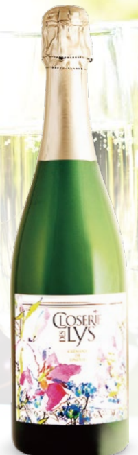
クロズリー・デリ クレマン・ド・リムー 750ml 2,100円

スパークリングワインの故郷、南仏リムーで作られた、オスメ2本。果実味あふれる土着品種で作られた、ブランケット・ド・リムー。