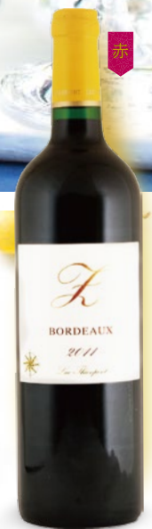
ゼド Z 2011 750ml 2,080円