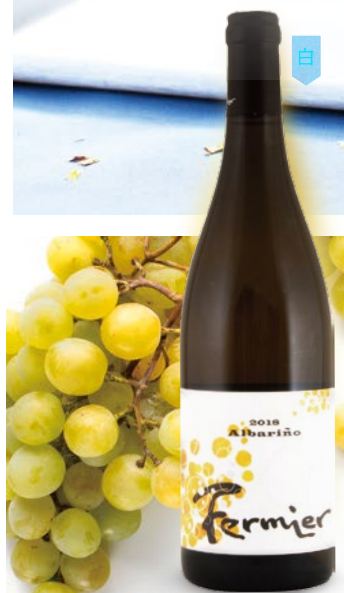
フェルミエ アルバリーニョ 750ml 5,000円

早摘みを行うことで温暖な南仏でありながら酸味を引き出し、シャンパーニュを意識したクレマン・ド・リムー。華やかなラベルそのままの、香り高いスパークリングです。